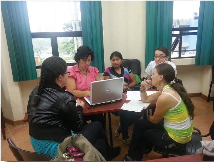
Taller de validación con población estudiantil de centros universitarios