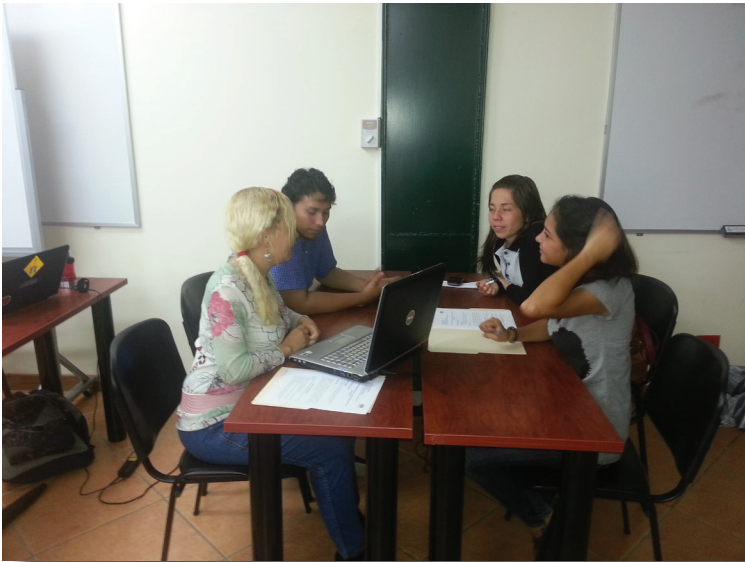
Taller de validación con población estudiantil de centros universitarios