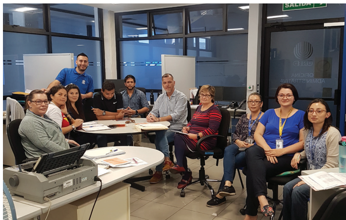
Sesión de trabajo con personal del Centro Universitario de Cartago 2020