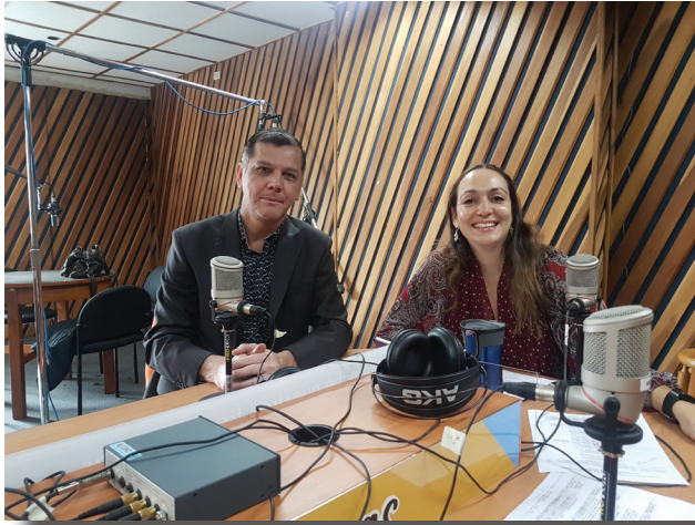
Programa Radio Universidad-UCR 2018