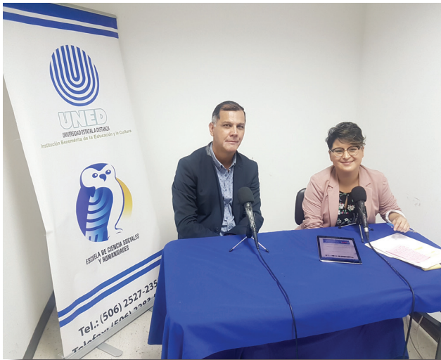
Facebook Live ECSH-UNED 2019