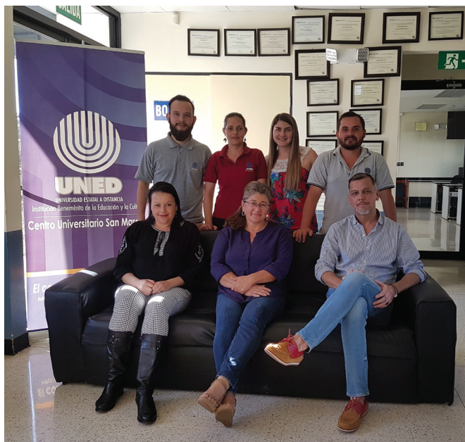
Sesión de trabajo con personal del Centro Universitario de San Marcos 2020