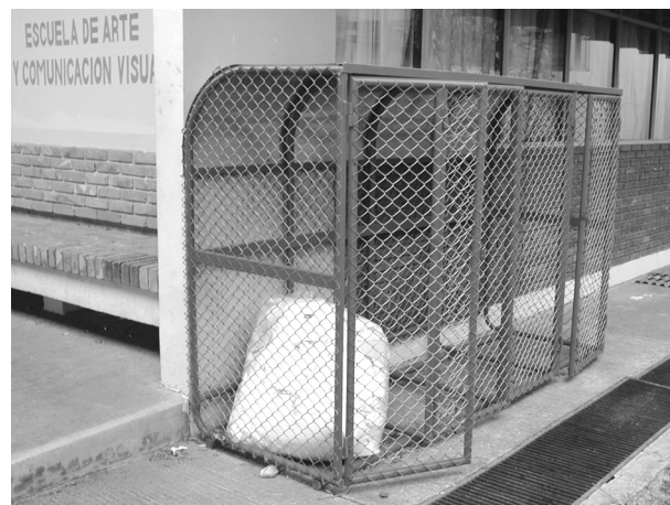
FIG. 2. Contenedor secundario.

Cada recolector primario tiene cuatro contenedores plásticos a los que se les pone bolsas plásticas para que los residuos puedan ser manipulados con mas facilidad e higiene. Las bolsas plásticas que se utilizan son transparentes con el objetivo de facilitar el manejo y clasificación del material en el Centro de Acopio Institucional que es el lugar en el que se completa la separación y se embala el material que será enviado a reciclar. Además, esas bolsas son gruesas para garantizar su reutilización en al menos 5 ocasiones, pero el costo de las mismas es mas elevado que el de las bolsas negras tradicionales. Las bolsas utilizadas en los contenedores primarios son marcadas con el nombre de la unidad administrativa de donde proceden,