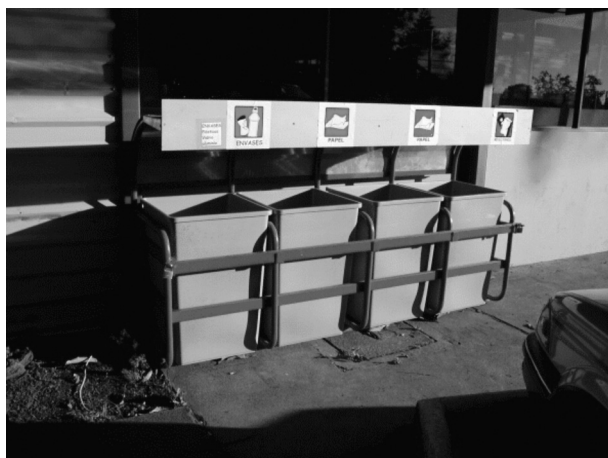
FIG. 1. Batería primaria.

Entre noviembre del 2004 y diciembre de 2005 se realizaron entrevistas abiertas orales a 120 funcionarios (conserjes, personal administrativo y académico) y a 500 estudiantes. También se hicieron evaluaciones mediante observación directa, con una duración de 40 horas semanales de trabajo de campo, por 50 semanas, para un total de 2000 horas. En todos los casos, el objetivo de las entrevistas y observaciones fue identificar los obstáculos para el buen manejo de residuos sólidos de la universidad.