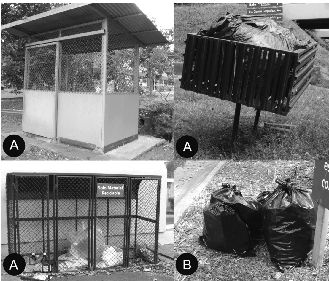
FIG. 4. Estructuras o lugares en los que se pone el material mientras espera ser llevado al relleno sanitario por el servicio de recolección de basura. (A) Lugares protegidos (Casita, canasta, y recolectores secundarios); (B) Lugares desprotegidos (suelo).

Durante 5 días en mayo del 2005 se clasificó la higiene de los lugares en donde se depositan las bolsas mientras pasa el camión recolector que lleva los residuos al relleno sanitario. Los sitios se dividieron en dos tipos: 22 lugares protegidos contra perros y otros mamíferos (recolectores secundarios, casitas y canastas elevadas) y 18 lugares desprotegidos (suelo a la orilla de las calles) (Fig. 4). La evaluación de los sitios se hizo de manera cualitativa en: buena (no había residuos fuera de las bolsas ni desprendían mal olor), regular (había pocos residuos fuera de las bolsas y no olía mal), mala (había muchos residuos fuera de las bolsas y olía mal) y pésima (había muchos residuos acumulados que se extendían a varios metros alrededor del lugar y olía muy mal).