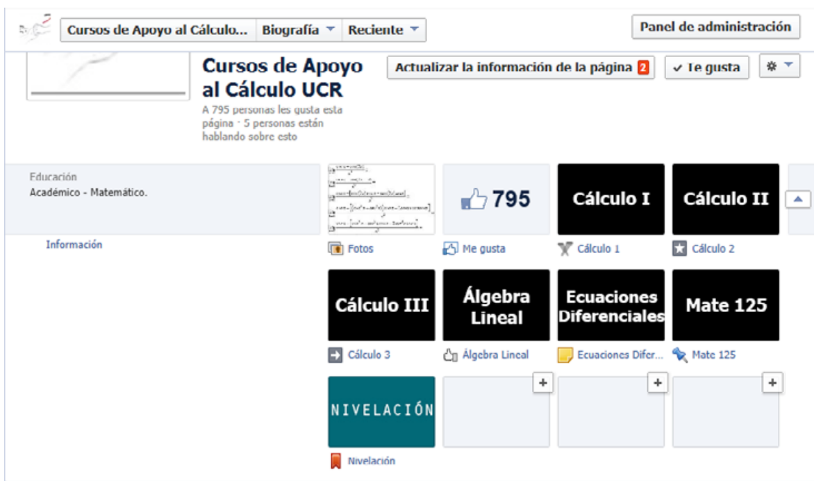
Figura 7. Interfaz principal del Proyecto Facebook de cursos de Apoyo al Cálculo

Las publicaciones de mayor alcance son todas las que se refieren a los materiales incluidos en las etiquetas de los cursos. En la Figura 7 se observan las diferentes etiquetas.