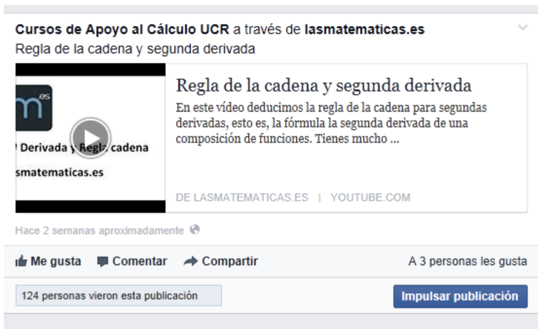
Figura 6. Tipo de publicación video sobre aplicaciones de la derivada

Las publicaciones de mayor alcance son todas las que se refieren a los materiales incluidos en las etiquetas de los cursos. En la Figura 7 se observan las diferentes etiquetas.