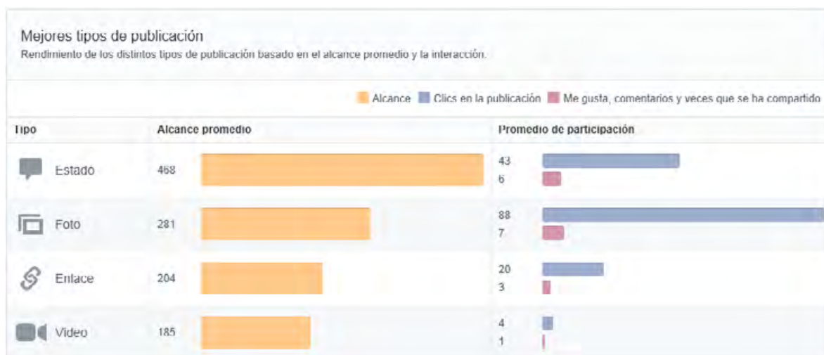
Figura 1. Rendimiento de los distintos tipos de publicación basado en el alcance promedio y la interacción

Los materiales incluidos en cada una de las etiquetas de los cursos han sido elaborados por docentes graduados en enseñanza de la matemática. Se les solicita a los docentes que el material contenga ejercicios con sus respectivas respuestas, digitados en latex de ser posible. El material debe ser entregado por semana en formato digital a la coordinación del proyecto de investigación “Bases matemáticas, pilar fundamental en el desempeño del ingeniero industrial”. Antes de subirlo al servidor se redacta una descripción del contenido del material, la cual ubicará al usuario en cuanto a los objetivos académicos que se están cubriendo según los cursos oficiales impartidos por la Escuela de Matemática. Cabe destacar que el tipo de publicaciones determina la movilidad que los fans ejercen sobre la página. En la Figura 1 se observa el rendimiento por tipo de publicación durante el mes de junio.