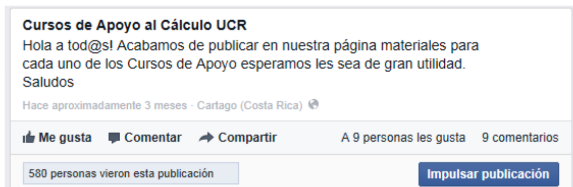
Figura 4. Tipo de publicación estado sobre materiales incluidos en las etiquetas

En la Figura 4 se muestra otro ejemplo del tipo de publicación estado con un alcance de 580 personas.