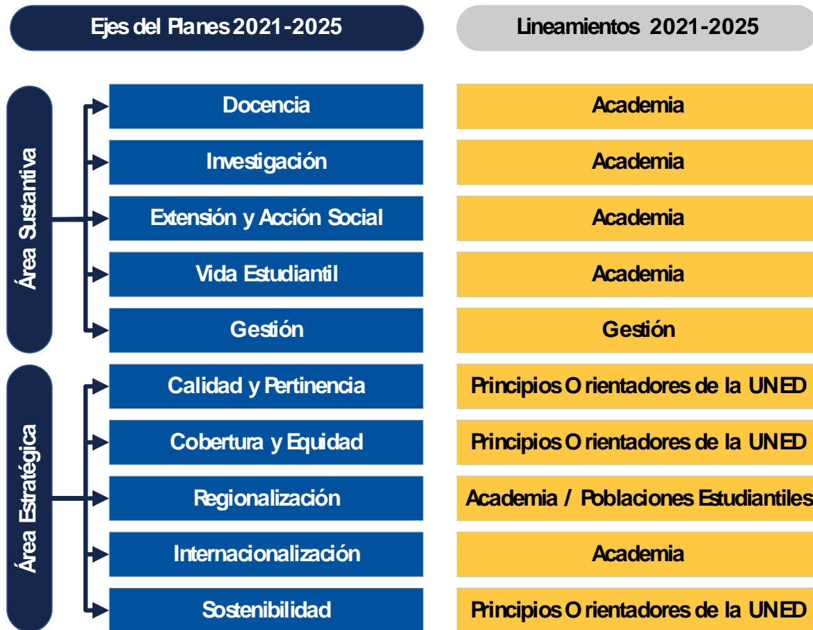
Figura 4. Vinculación del PLANES 2021-2025 con los LPI 2021-2025

Fuente: elaborado por el Centro de Planificación y Programación Institucional, octubre, 2020.