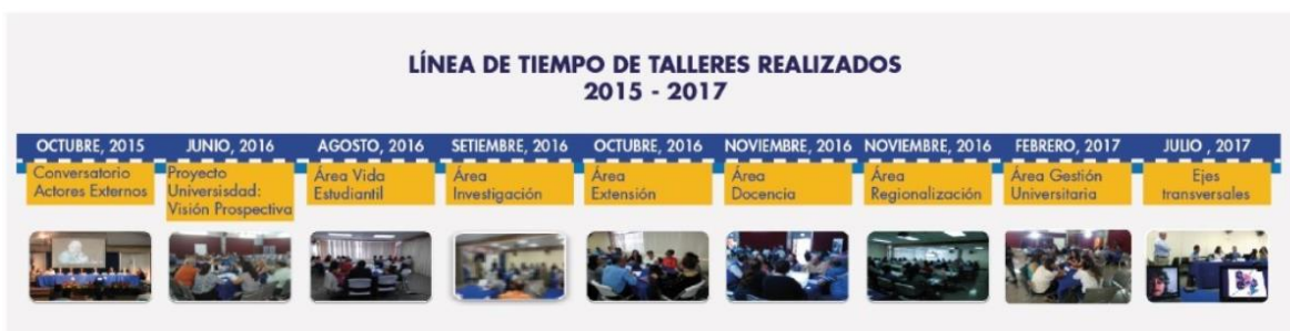
Figura 3. Línea de tiempo de las actividades regionales realizadas en el año 2017 para la construcción del Análisis de Contexto de la UNED