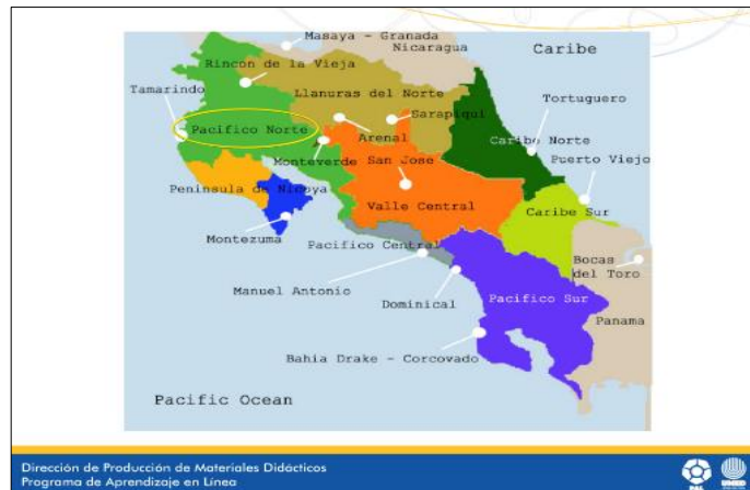
Figura 8. Ejemplo una imagen que contiene detalles esenciales de visualizar, por lo que ocupa más espacio en una diapositiva.