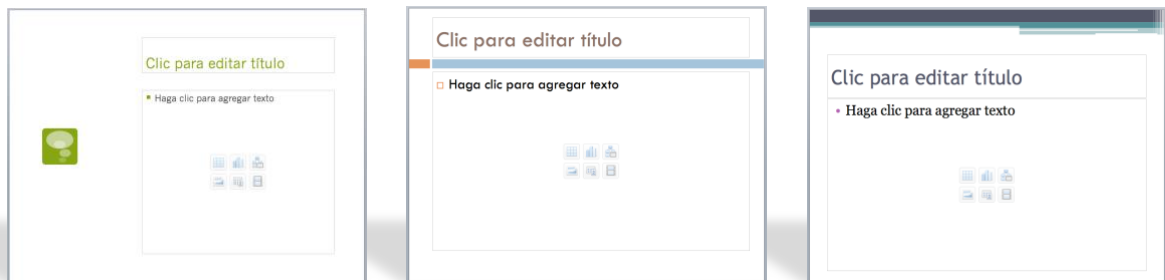
Figura 9. Ejemplo de tres diapositivas con fondos claros y algunos detalles en color, que permiten dar un buen contraste con el texto que se utilizará.