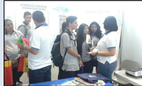
Estudiantes participantes en la Expocalidad, 2016