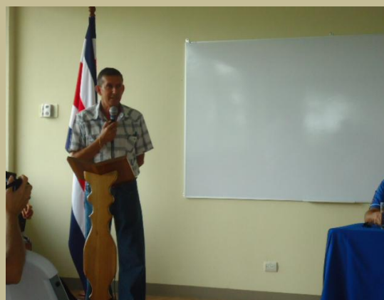
Discurso del Delegado de Don Euclides.