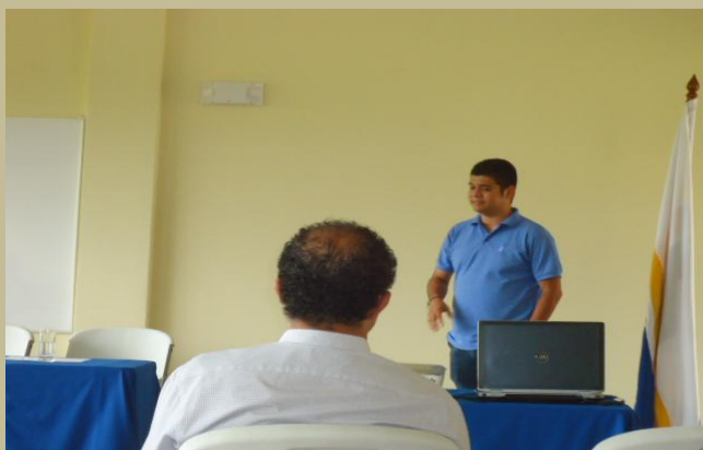
Conferencia Representante del MINAET