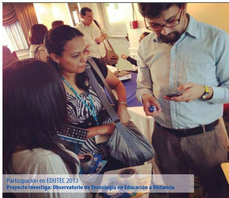
Participación en EDUTEC 2013 Proyecto Investiga: Observatorio de Tecnología en Educación a Distancia