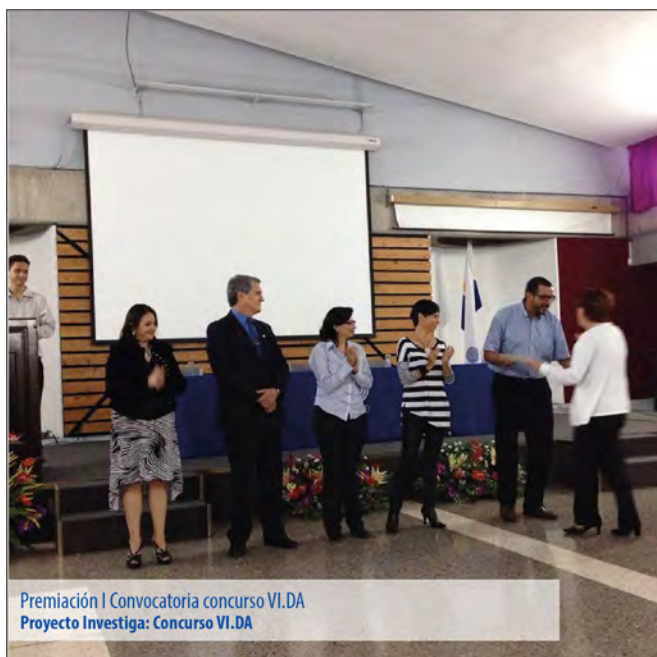
Premiación I Convocatoria concurso VI.DA Proyecto Investiga: Concurso VI.DA