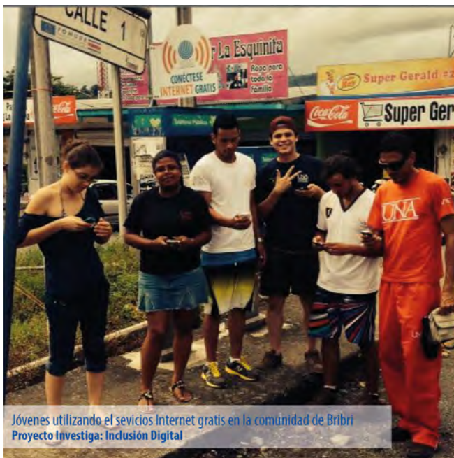
Jóvenes utilizando el servicios Internet gratis en la comunidad de Bribri Proyecto Investiga: Inclusión Digital