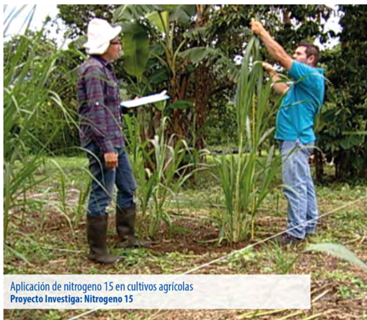
Aplicación de nitrógeno 15 en cultivos agrícolas Proyecto Investiga: Nitrógeno 15