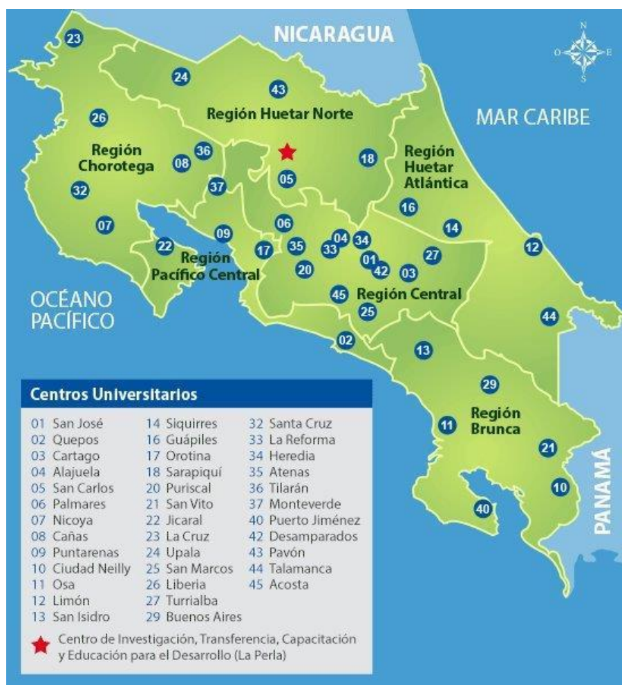
Mapa: Centro de Investigación y Planificación Institucional, 2013

La Unidad de Evaluación Institucional perteneciente al Centro de Investigación y Evaluación Institucional, como entidad responsable de la valoración de los procesos de la universidad ha coordinado este proceso evaluativo con el Centro de Planificación y Programación Institucional. Los indicadores que aquí se exponen se focalizan en la gestión de los Centros Universitarios, contemplando las áreas de personal, recursos y alianzas, procesos estratégicos, resultados e infraestructura. Durante el 2014 hubo un cambio de Directora de Centros Universitarios, sin embargo se obtuvo la misma colaboración de años anteriores.