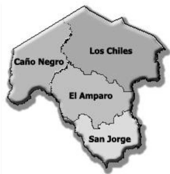
Mapa del cantón de Los Chiles

El cantón de Los Chiles se ha caracterizado por su alta pobreza y poco desarrollo a nivel nacional. Es una zona muy poco poblada y con muy pocas oportunidades laborales.