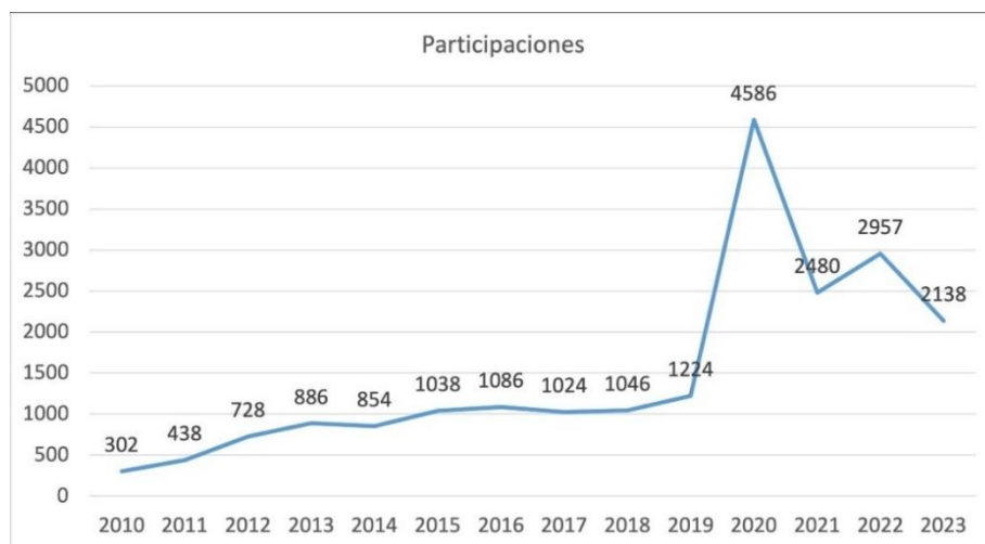
Figura 2. Cantidad de participaciones por año en actividades de capacitación. Informe de Labores CECED, 2023.

Temas compartidos de interés con la Vicerrectoría de Docencia siguen siendo: el fortalecimiento de lo virtual en la oferta educativa, el diseño de procesos de investigación más viables para los trabajos finales de graduación, la diversidad en las técnicas e instrumentos de evaluación de los aprendizajes, la aplicación del diseño universal del aprendizaje; temas con los que durante el año se dieron conferencias magistrales, talleres y encuentros con especialistas invitados. Sobre ellos, hay que seguir insistiendo en la obligada capacitación y actualización del grupo profesional docente en más tiempo y con mayor detalle de dedicación, porque así es que se puede garantizar mejor la calidad y pertinencia de la oferta educativa. Es de hecho obligado pensar en un nuevo perfil docente a distancia para la UNED.